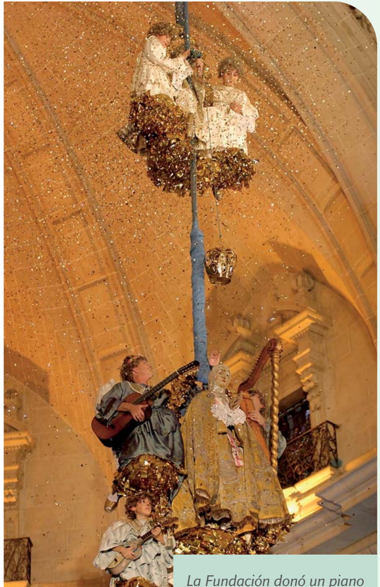
La Fundación donó un piano de cola Petrof al patronato del Misterio de Elche