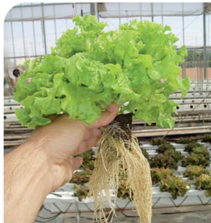
Novedoso sistema para producción de lechugas en cultivo hidropónico