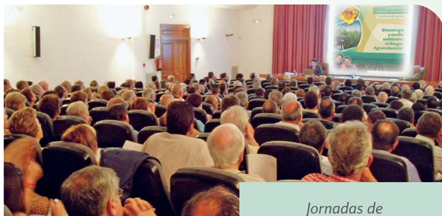
Jornadas de Puertas Abiertas

Estas visitas posibilitan el acercamiento a la sociedad al trabajo que realizamos en nuestro Centro de Paiporta. Durante 2007, recibimos la visita de 800 niños y 1.525 personas procedentes de 45 municipios de la Comunidad Valenciana.